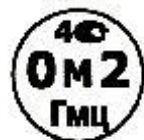
Рисунок А.2 — Поверительное клеймо ГНМЦ