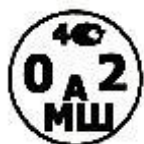
Рисунок А.1 — Поверительное клеймо ЦСМ